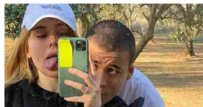
Jasmine Carrisi e Alessandro Greco sono una coppia: la foto