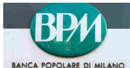
Banco Bpm, entro 2 settimane completate erogazioni prestiti fino a 25.000 euro - AD