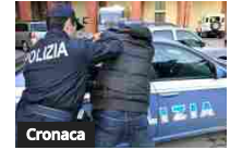
Ricercato in mezza Europa per spaccio, 38enne serbo fermato nel Mantovano