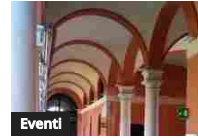
Rassegna Barattalcubo, i bambini a scuola di fumetti