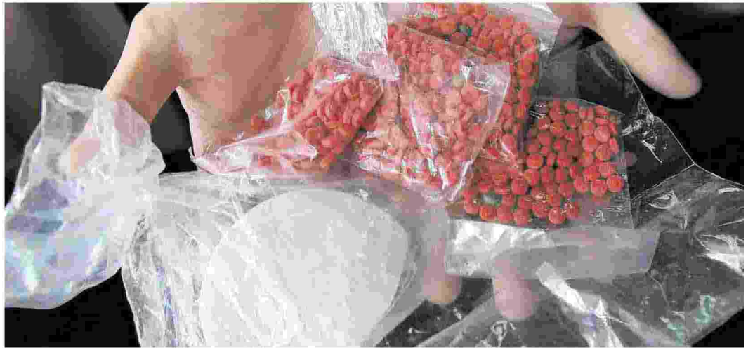
Cocaina e pasticche: nell'isola il consumo è in aumento tra i giovanissimi

ANNI: L'ETÀ IN CUI I RAGAZZINI INIZIANO A FUMARE MARIJUANA